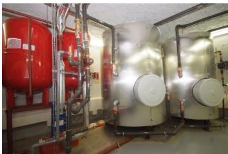
◀ Production d'eau chaude sanitaire