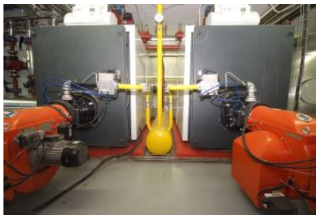
Chaudières gaz naturel ▲