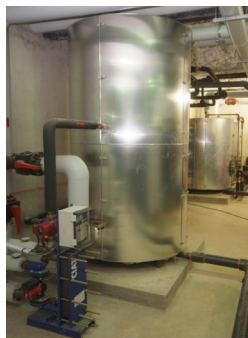
◀ Ballon stockage solaire