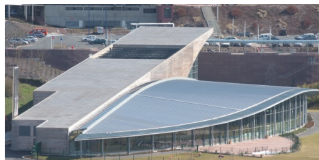
Centre Nautique ▶